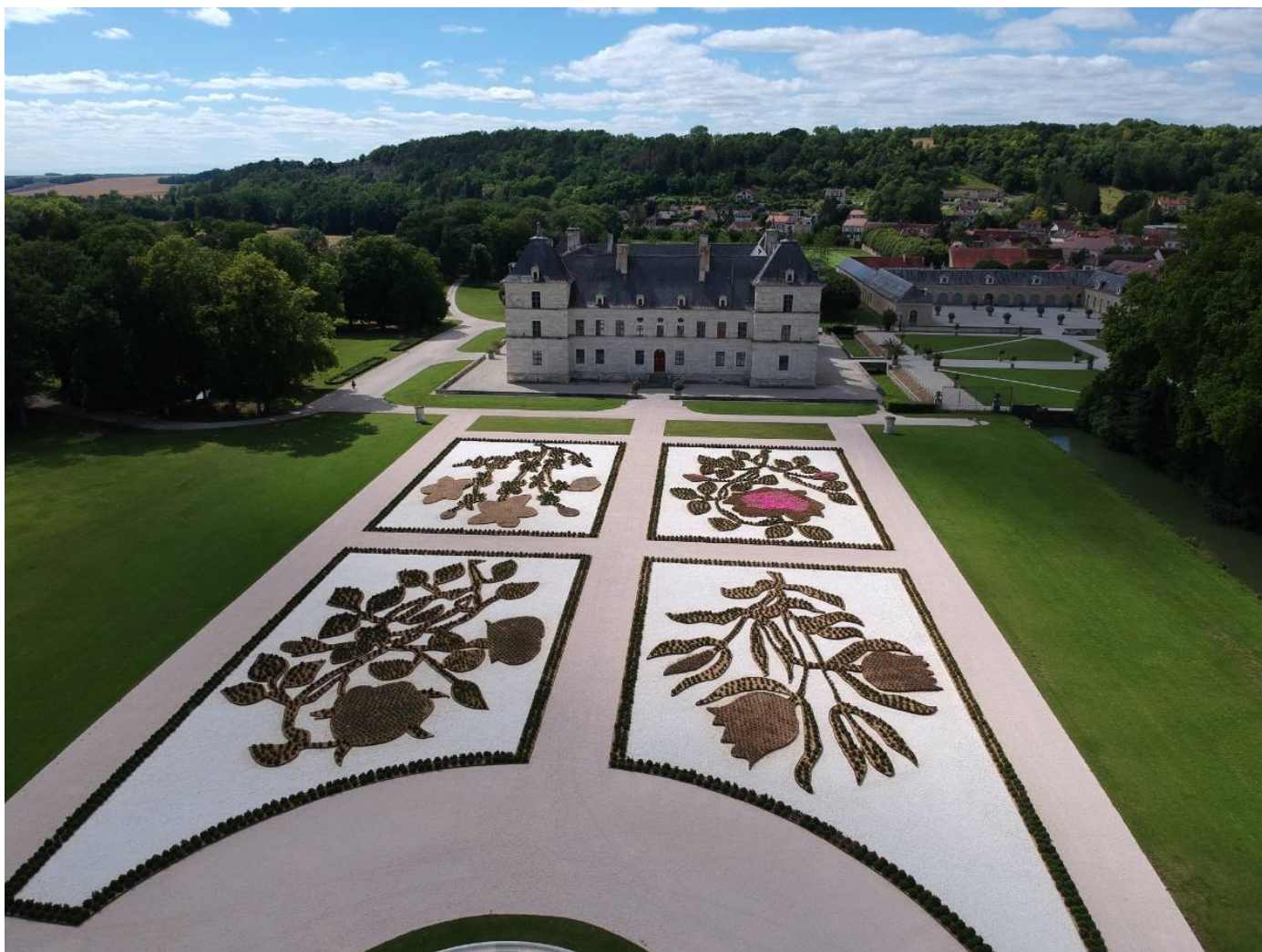
Coup de cœur pour le parc et son parterre aux fleurs au château d'Ancy-le-Franc.

Château d'Ancy : du mardi au vendredi, de 10 à 12h?30, et de 14 à 18 heures?; les week-ends de 10 à 18 heures. Tarif : 13 euros, réduit : 11 euros. Contact : 03.86.75.14.63.